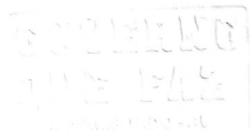
CLEOVAN FLORENTINO DE ALMEIDA PREFEITO

Exigência: Ensino Médio Vagas: 01 (UMA) Salário Base: R$ 300,00 (trezentos reais) Carga Horária Semanal: 40 h